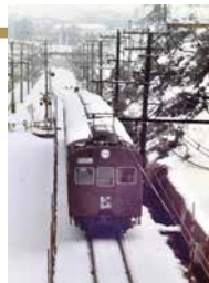
中山橋から鶴居駅方面を撮影 撮影時期：昭和 53 年

現在の JR 横浜線では、銀色の車体に緑と黄緑のラインカラーの電車が走っていますが、昭和の時代には「チョコレート電車」の愛称で親しまれた茶色の電車が走っていました(昭和 54(1979) 年運行終了)。また、昭和 47(1972) 年以降は、他線の中古車が転入し、スカイブルーやウグイス色の電車なども見られました。現在と見た目がよく似た電車が登場したのは、昭和 63(1988) 年です。時代とともに、私たちが乗ってきた電車も、様変わりしていきました。