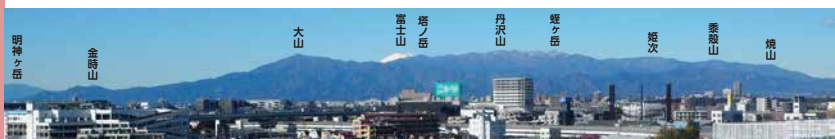
◀高尾山頂上付近からの丹沢山方面 ※山の名前と位置は目安です