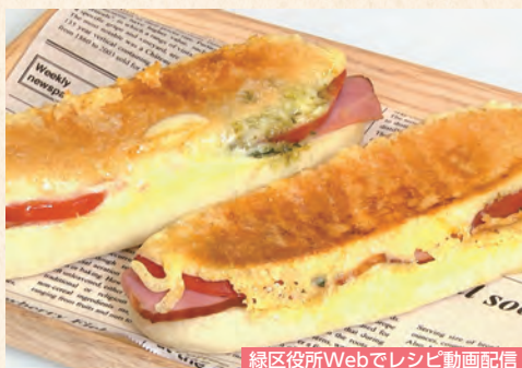
緑区役所Webでレシピ動画配信