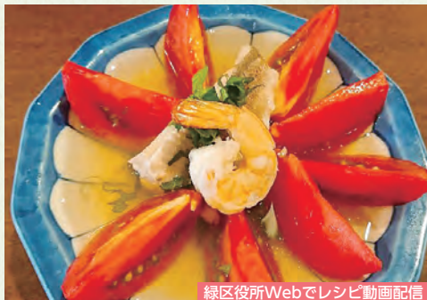
緑区役所Webでレシピ動画配信