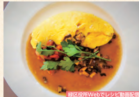
緑区役所Webでレシピ動画配信