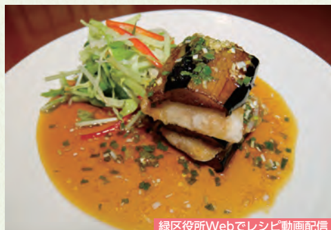
緑区役所Webでレシピ動画配信