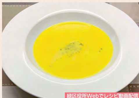
緑区役所Webでレシピ動画配信