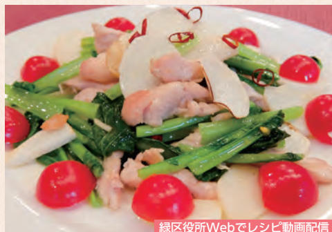
緑区役所Webでレシピ動画配信