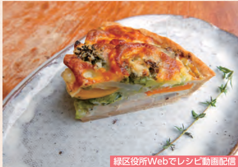
緑区役所Webでレシピ動画配信