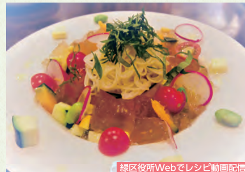
緑区役所Webでレシピ動画配信

塩こうじは糖分が多いため、白身魚が焦げないように注意しながら焼いてください。白ワイン、トマトをフライパンに入れた後、水分を煮詰めて、適宜味を調えることがポイントです！