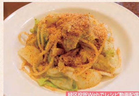
緑区役所Webでレシピ動画配信