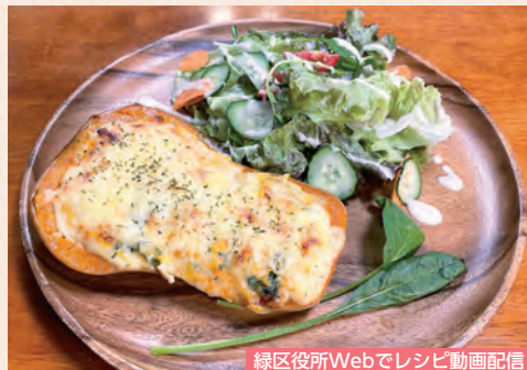
緑区役所Webでレシピ動画配信