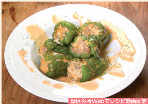
緑区役所Webでレシピ動画配信