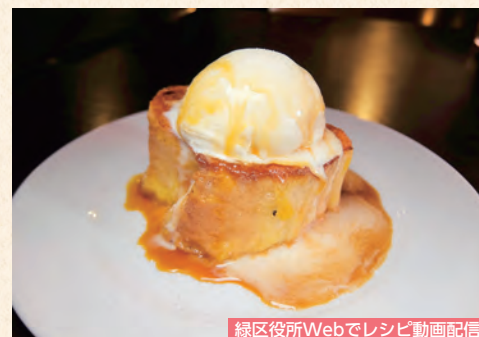
緑区役所Webでレシピ動画配信