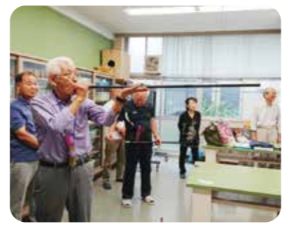
高齢者交流イベント「高等学校」