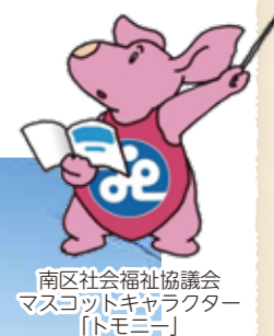
南区社会福祉協議会 マスコットキャラクター 「トモニー」