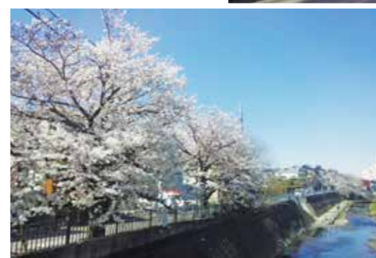
花見橋から見た大岡・上大岡方面の桜