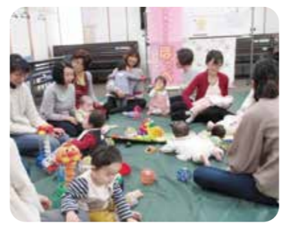
子育てサロン「ほっぺ大岡・ほっぺ中里」