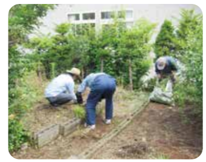
ちよこっとボランティア活動「大岡ふれあいサポート」