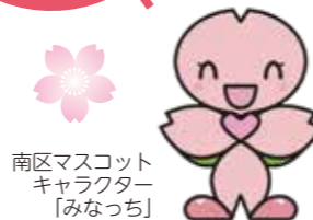
南区マスコット キャラクター 「みなっち」