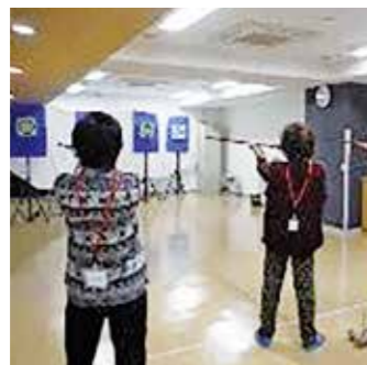
元気づくりステーション [大岡吹矢の会]