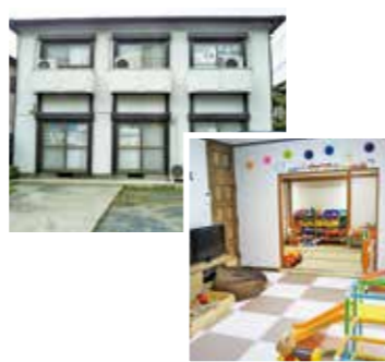
むつみおもちゃ文庫