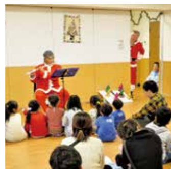
子どもの居場所 [中里ふれあい広場いきいき]