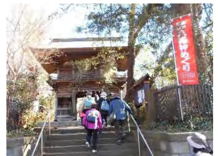
地域での活動の様子【健康づくりウォーキング】