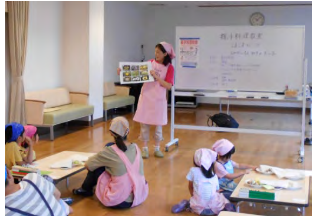
地域での活動の様子【おやこ料理教室】

*参考出典：内閣府の平成29年(2017年)度「高齢者の健康に関する調査」により