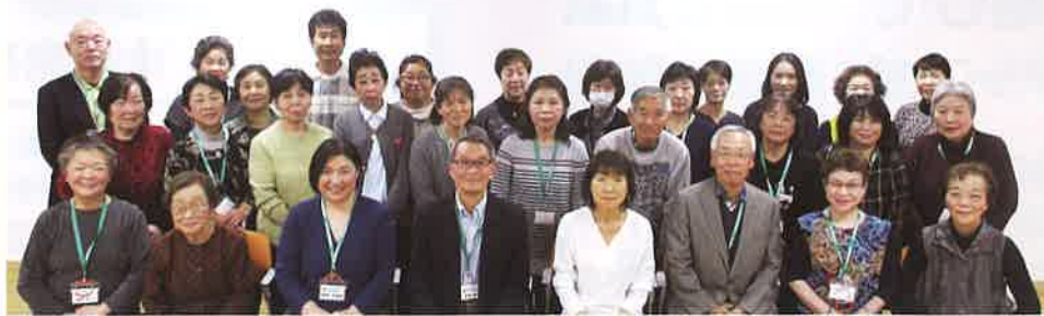
南区保健活動推進員(16地区 会長・副会長の集合写真)