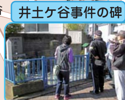
井土ヶ谷事件の碑