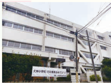
創立150周年を迎えた太田小学校

太田東部連合の一番の行事は10月に行う健民祭。子どもから大人まで大勢が参加します。会場となる太田小学校は今年、創立150周年を迎えました。健民祭にはこれから多くの方に参加してもらいたいと思っています。