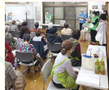
特殊詐欺防止啓発の様子

南区には14年前に引っ越してきました。町内会班長の頃、会議でよく意見を言っていました。それで、役員目の目に留まったのでしょうか？「役員をやってくれないか」と言われ、まずは総務の仕事をしているうちに町内会長になりました。さらに、連合町内会でも助言をしていると連合副会長に。そして、(とんとん拍子に事が進み)現在に至ります。良い意見も、難しい意見も発言してくれる方は貴重だという思いを持ってこれからも携わっていきたいです。