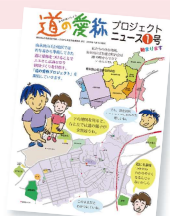
話し合って完成した広報誌