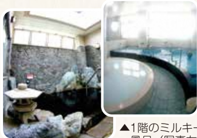
▲1階のミルク風呂(写真左)