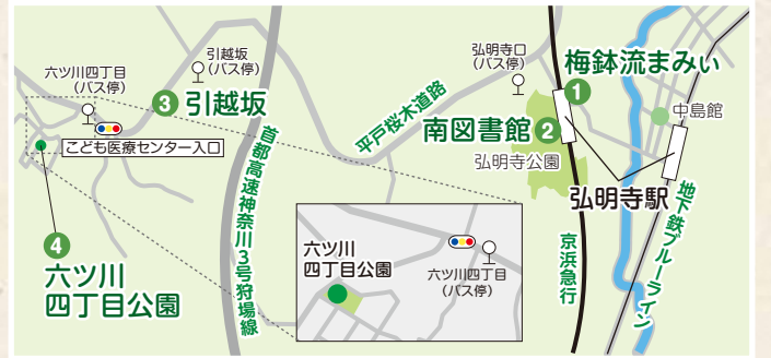
※さんぽには区民生活マップが便利です(区役所1階窓口案内で配布)

「まちなみさんぽ」ではみなっちと一緒に見つけた素敵なスポットを紹介。今回は京急弘明寺駅周辺から六ツ川地区へ散歩します。多様な本をそろえる図書館から坂を越えて丘の上の公園まで歩いてみませんか。