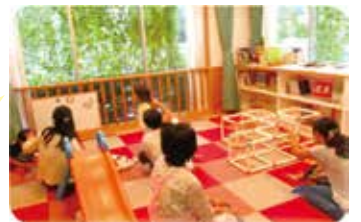
▲ママと子のホットタイム（他会場）

2月22日（金）、3月8日（金）の10時～12時にログハウス「静かな部屋」にて近隣の子育てサークルの交流を予定しています。子育て支援者がいて、赤ちゃんや未就学のお子さん（サークルの人以外）も安心して遊べますのでぜひお越しください。