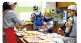
▲カンパンをリメイクしたビスケットを来場者に配布