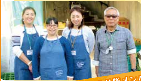
おもいやり隊メンバーのみなさん

中村地区は急な坂道も多く、日々の買い物に困っている高齢者が多い地域です。そこで、小学生の子どもを持つお母さんたちが中心となって、高齢者の買い物支援を中心とした支援活動を行っています。この活動の他にも、地域の空きガレージなどでパンや野菜などを販売する「ママ・マルシェ」を定期的で開催しています。