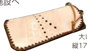
大きさ 縦17cm×横8cm マチなし