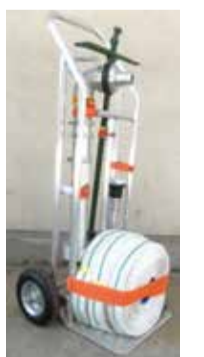
スタンドパイプ式 初期消火器具(一例)