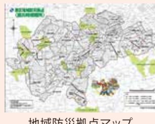
地域防災拠点マップ