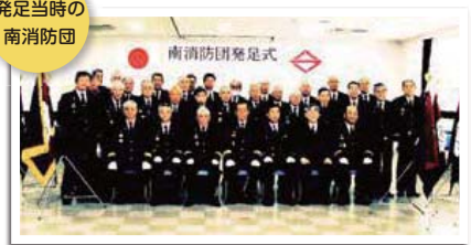
発足当時の南消防団

平成22年4月1日、南区の寿消防団と大岡消防団の二つの消防団が統合し、南消防団が誕生しました。寿消防団は大正11年に寿消防組として、大岡消防団は昭和14年に大岡警防団としてそれぞれ発足し、昭和23年に、寿消防団・大岡消防団の2団が組織されました。この歴史と伝統ある消防団を統合したことにより、区民の皆さんにとって分かりやすい消防団組織となっただけではなく、指揮命令系統を一本化し、大規模災害発生時に迅速に対応することが実現しました。