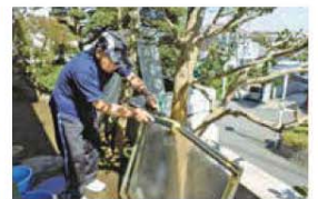
▲スタッフの約半数は男性。網戸掃除などの作業には男性が活躍!

「活動だけではなく一緒に運営できるメンバーが増えたらうれしい。他の地区でも、活動がはじまったら良いですね」と、笑顔の二人が話してくれました。