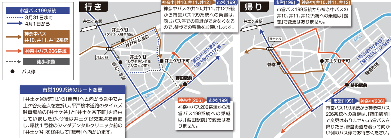
図 交通局路線計画課 ☎326-3865 ☎322-3912、図 区役所区政推進課 ☎341-1233 ☎341-1240

市営199系統は4月1日以降も、一部ルートを変更したうえで、引き続き運行しています。ルート変更に伴い、南区役所に向かう際に、神奈中バスの井10、井11、井12系統から市営バス199系統へ乗り継ぐときには、徒歩でバス停の間を移動する必要があります。その他の乗継は、以前と同じです。