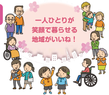
図 事業企画担当 ☎341-1183 ☎341-1189