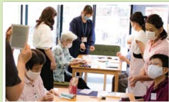
▲みんなで楽しく介護予防