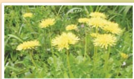
↑ 西洋タンポポとはガクの形が異なり、春のみ咲く日本タンポポ

「井上良齋窯場・登り窯」は、南区の原風景をとどめる場所です。現在では目にする機会が少なくなった希少種の「日本タンポポ」や、樹齡200年を超える「タブノキ」や「カキノキ」をはじめ、桜や紅葉の木などもあり、住宅街の中でも四季折々の自然を感じられます。