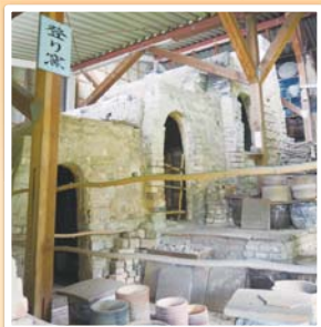
↑ 耐火レンガ造りで3つの焼成室があります。

傾斜地を利用して階段状に、陶磁器を焼く部屋が並んでいるものを登り窯といいます。この登り窯は、第二次世界大戦前まで使われていました。