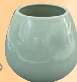
せいじ ちどりせんこくもんみずせし 青磁千鳥線刻文水指 永田地域ケアプラザに展示

第二次世界大戦までは、この登り窯で陶磁器を大量生産し、アメリカやヨーロッパ各国など海外へ輸出していました。戦後の主な作品は、横浜美術館などに所蔵されているほか、永田地域ケアプラザにも1点展示されています。