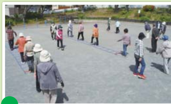
▲公園で脳トレウォーキング

この指針について、現状に合わせた取組の見直しなどを行い、名称も「横浜型地域包括ケアシステムの構築に向けた南区アクションプラン」へ変更して、改定します。