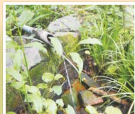
← ↑ 山王台地からしみだす湧き水は1年中途絶えないそうです。珍しいサワガニも見られます。

*1 ビオトープ:本来その地域に暮らす生き物に必要な条件がそろった「すみか」のこと。