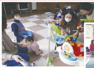
♪子育てサロンで楽しく遊ばす♪

南区の住民一人ひとりが「健康で安心して暮らせるまち」を目指して、区民の皆さまと区役所・区社会福祉協議会・地域ケアプラザなどが力を合わせて進めていく活動や取組をまとめたものです。