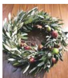
▲オリーブのリース