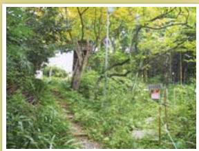
↑ 季節ごとにさまざまな草花が楽しめます。