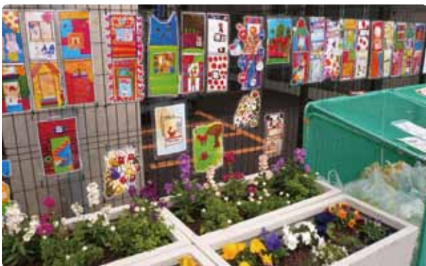
黄金町2丁目 ごみ集積所付近