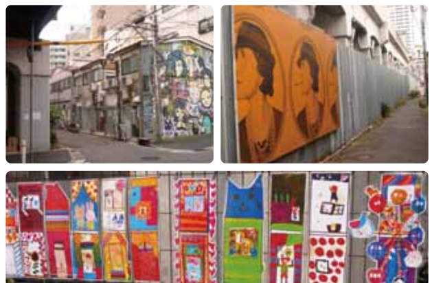
京急日ノ出町駅~黄金町駅の高架下