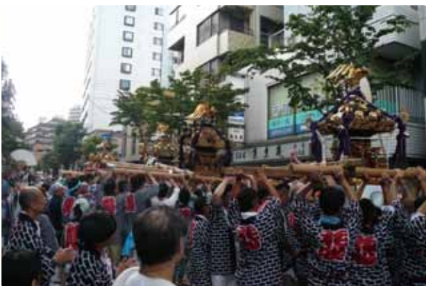
野毛 子の大神例祭