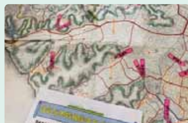
文化歴史マップづくり