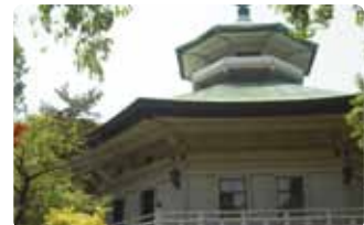
八聖殿郷土資料館