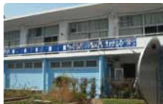
まかどシーマリンパーク