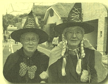
(Honmoku/ハロウィン仮装パレードにて)