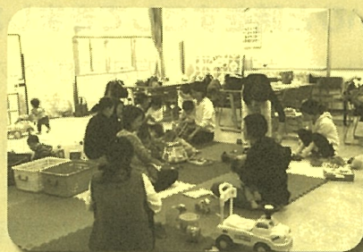
(区内の各地域ケアプラザで開催)