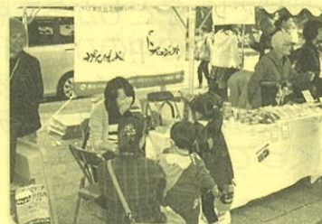
～子どもたくさん来ました～