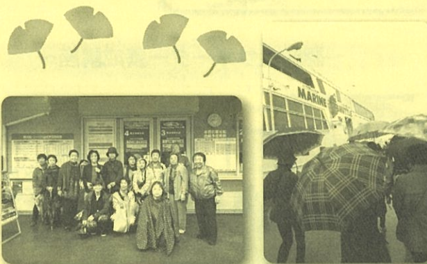
～ゴールの乗り場にて～