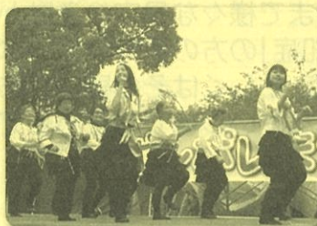
～楽しい手話ダンスを披露～

このおまつりが回を重ね、地域に根付くにつれ、「障害」の理解も深まっていると実感しています。これからも誰もが笑顔で交流できる場を大切にしなければと思います。