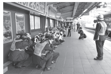
昨年度実施した関内駅での様子