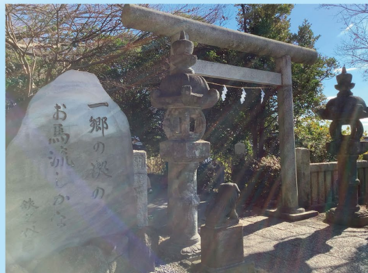
掲載されている写真は、2022年度の応募作品です。