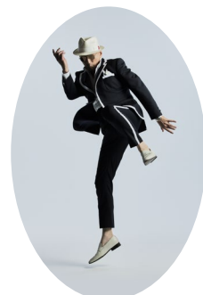
特別サポーター 横山剣 (クレイジーケンバンド)