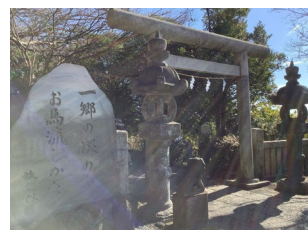
2022年度 小中学生部門金賞 《本牧の光の入り口》