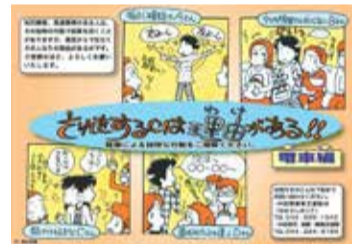
それをするには理由がある!!

「それぞれの違いを理解し、認め合い、やさしい気持ちで受け入れられるように」。この思いを皆さんと共有できるよう、これからも取り組んでいきます。