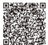
動画はこちらから

ほかにも、区民祭り「ハローよこはま」では、中区の商店街のPRブース「Hello商店街」を展開しています。今後も商店街の多様な魅力を発信していきますので、地域の商店街へ、皆さんのエールをお願いします。