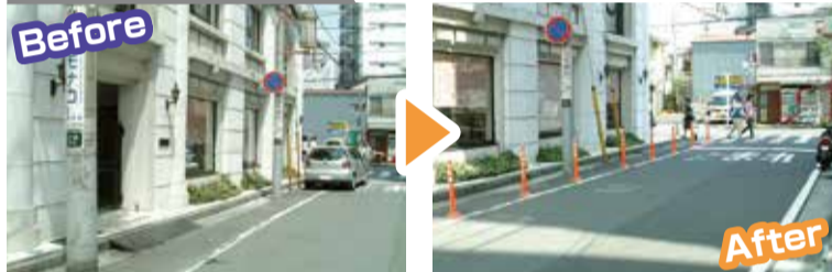
スクールゾーン 施工例

また、道路や公園の清掃や花壇の手入れを行っている地域や企業の皆さんへのサポートも行っています。身近な道路や公園がきれいに保たれているのは、このような活動をされている方々のご協力のたまものです。皆さんもぜひ、活動に参加してみてください。