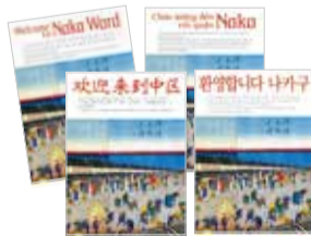
転入者にお渡ししているウェルカムリーフレット(英語・中国語・ハングル・ベトナム語の4種類)