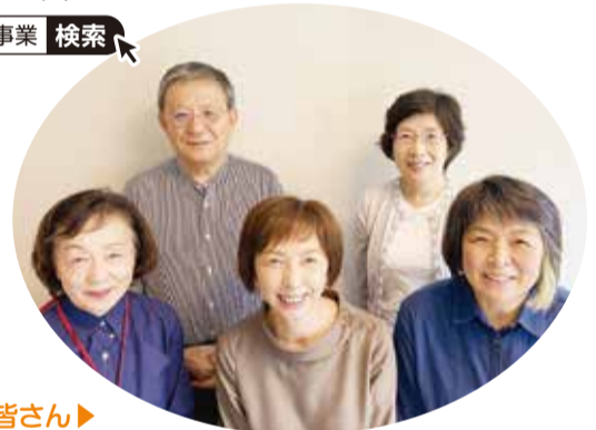
大石クリニック 認知症初期集中支援チームの皆さん▶

らみても、思い通りにはいかないこともあるかと思えます。苦しみを抱えているご本人だけでなく、周囲の人も気軽に助けを求められるようなお手伝いができるよう努力しています。ご本人とご家族が安心して納得のできる日々を送れるよう、一緒に問題に取り組んでいきましょう。