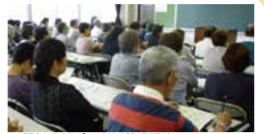
▲認知症サポーター養成講座

老人クラブとは、おおむね60歳以上の人なら、どなたでもいつでも入会できる高齢者の自主組織です。中区には53クラブ、約4,000人の会員が在籍し、スポーツ・ボランティア・趣味のグループなどで元気に楽しく活動しています。活動は機関紙「みちしお」でも紹介しています。コミュニティハウスや地区センター、麦田清風荘、中区役所(5階51番窓口)に置いてありますので、ぜひご覧ください。