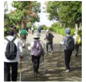
▲ノルディックウォーキング