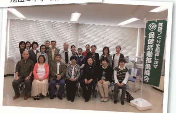
各地区 会長・副会長の皆様