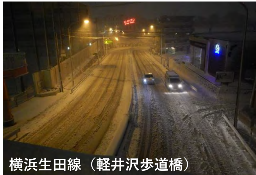
横浜生田線（軽井沢歩道橋）