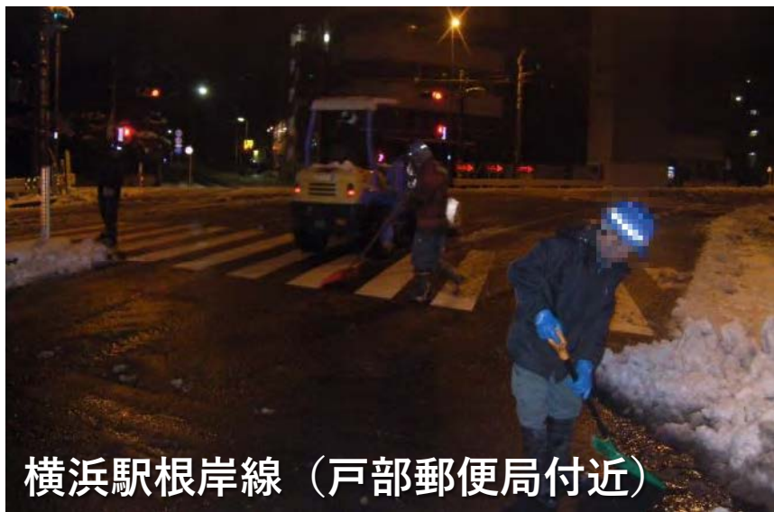
横浜駅根岸線（戸部郵便局付近）