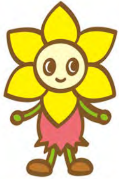
西区のマスコットキャラクター 「にしまるちゃん」