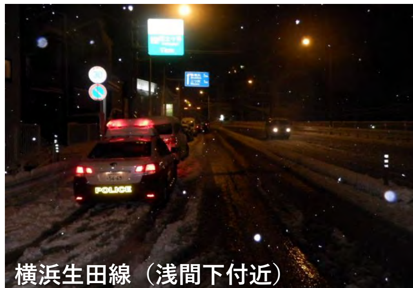
横浜生田線（浅間下付近）