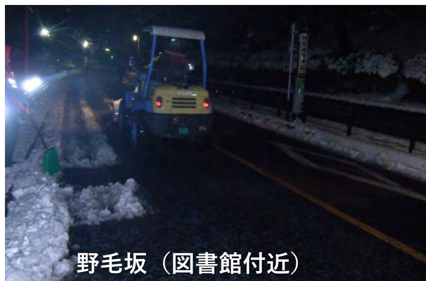
野毛坂（図書館付近）