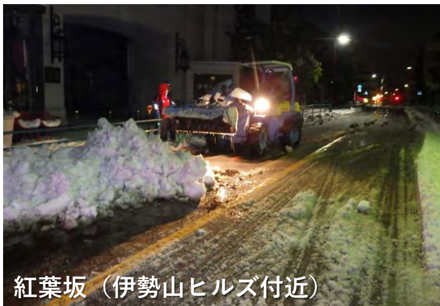
紅葉坂（伊勢山ヒルズ付近）