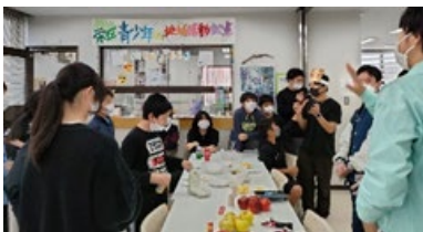
リンゴの甘さを糖度計で計測

SAKAE」に集まり、南部町のリンゴ3種類を食べ比べて、それぞれのおいしさを実感しました。ちよびり緊張しつつも、お互いの地域の様子を話し合ったり、アイドルの話で盛り上がったりして、若い世代間の交流の場となりました。栄区の若者たちからは「次はぜひ南部町に行ってみよう」という声も出ていました。