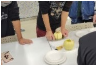
リンゴカッター 体験中

区民まつりの後、名久井農業高校の生徒と栄区の小・中・高・大学生が栄区青少年の地域活動拠点「フレンズ☆SAKAE」に集まり、南部町のリンゴ3種類を食べ比べて、それぞれのおいしさを実感しました。ちよびり緊張しつつも、お互いの地域の様子を話し合ったり、アイドルの話で盛り上がったりして、若い世代間の交流の場となりました。栄区の若者たちからは「次はぜひ南部町に行ってみよう」という声も出ていました。