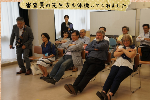
元気づくりのリーダー養成講座を視察 審査員の先生方も体操してくれました