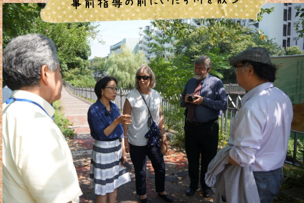
事前指導の前にいたち川を散歩