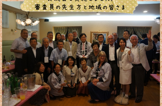
交流会も実施しました！ 審査員の先生方と地域の皆さま