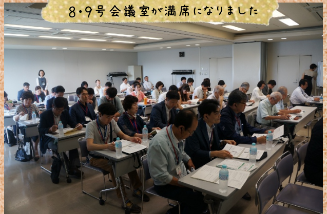
他都市や韓国からのお客様で 8・9号会議室が満席になりました