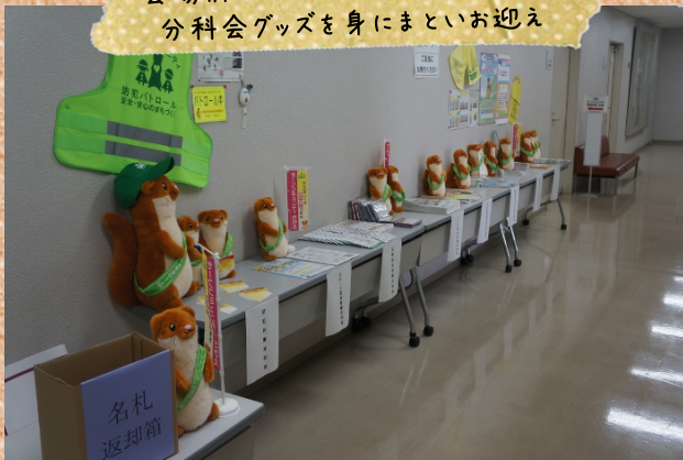
会場前ではたくさんのタッチーくんが 分科会グッズを身にまといお迎え