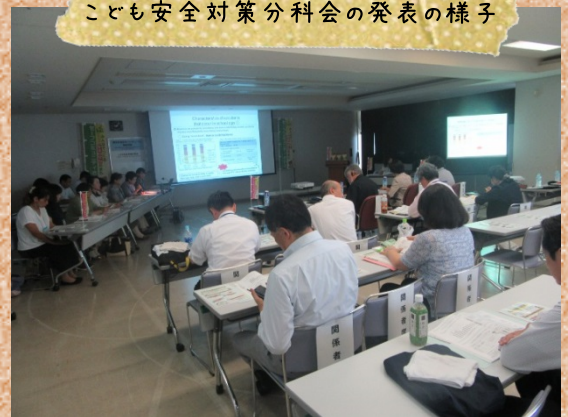
こども安全対策分科会の発表の様子