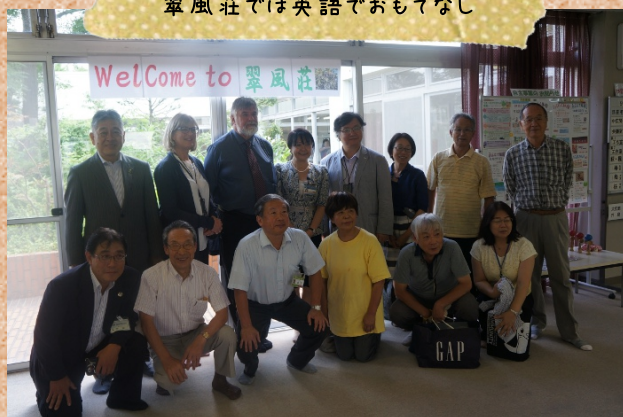
翠風荘では英語でおもてなし