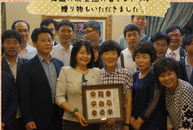
韓国の視察団の皆さまからは 贈り物もいただきました