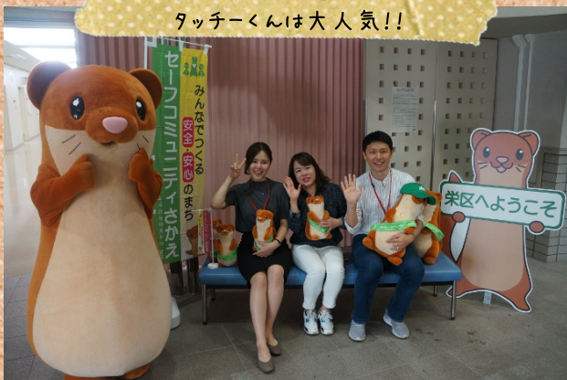
韓国からのお客様にも タッチーくんは大人気!!