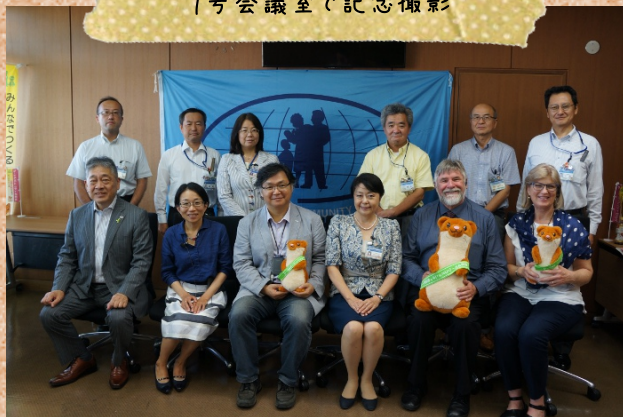
1号会議室で記念撮影