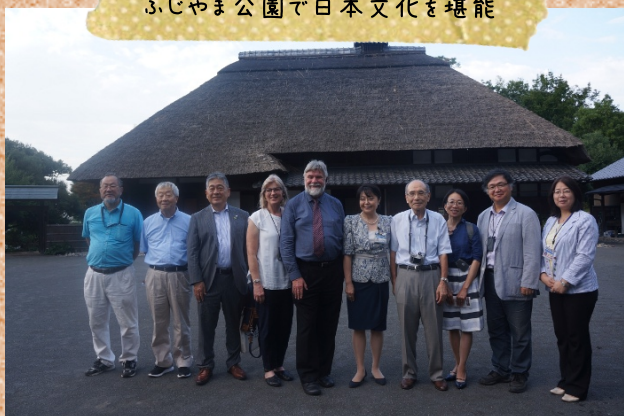
ふじやま公園で日本文化を堪能