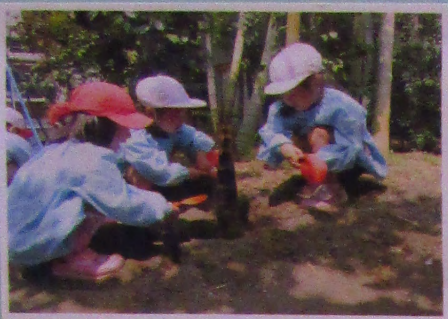
〔園庭で楽しいたけのこ掘り〕