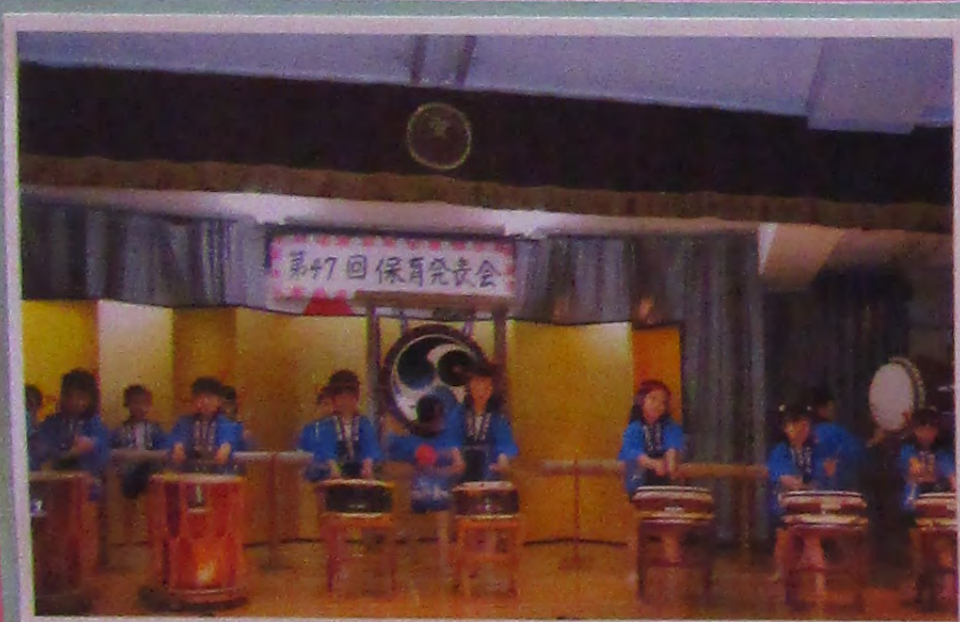
〔5歳児の日本太鼓演奏〕