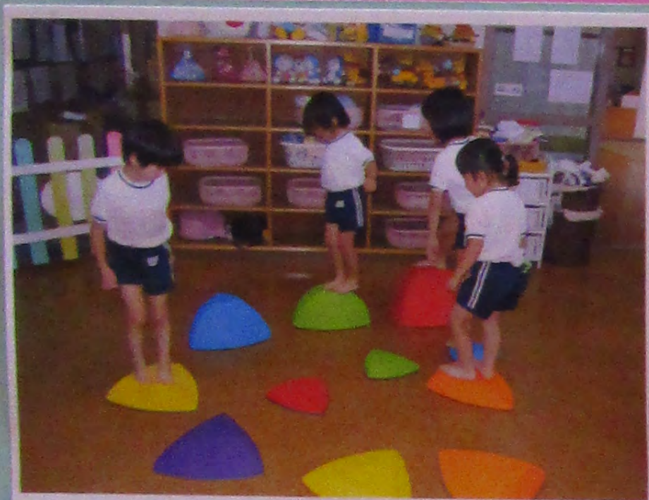
〔バランスブロックでお遊び〕