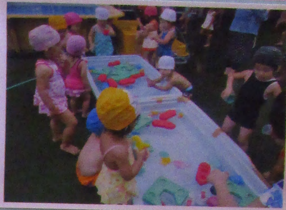
〔屋上で楽しい水遊び〕