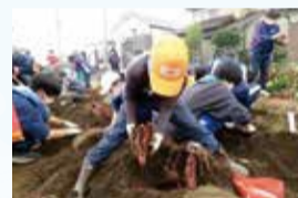
せやっこわくわくワーク