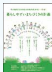
「暮らしやすいまちづくりの計画」冊子