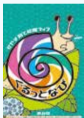
子育て応援マップ