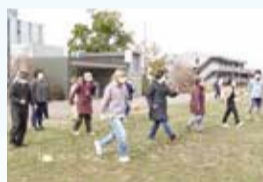
ウォーキング研修

子どもから高齢者まで幅広い年齢層を対象に、健康づくりに関する正しい知識の普及や予防啓発を進めるとともに、地域の関係団体と協働し、健康チェックや健康講座等を実施します。