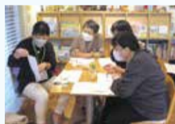
区民向け講座の様子