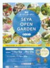
瀬谷オープンガーデン