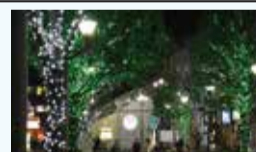
瀬谷駅前のイルミネーション