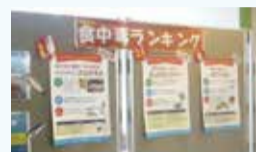
食中毒予防キャンペーン