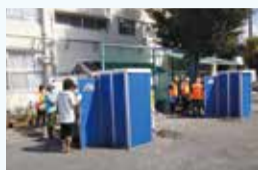
地域防災拠点訓練

地域で実施する防災訓練・研修会等への支援や、関東大震災発生から100年を契機とした更なる防災意識の啓発等により、地域防災力の向上につなげます。