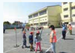
はまっこ交通安全教室