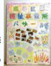
障害福祉事業所の製品販売