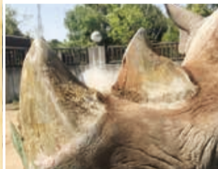
繊維でできている角

サイの特徴の一つである角は、漢方薬や装飾品などの目的で密猟者に狙われています。密猟によって1990年代に2,000頭台まで減少した生息数は、懸命な保護活動により5,500頭まで回復しましたが、現在も絶滅の危機にあることには変わりありません。