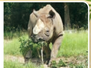
木の葉を食べるオスのニル

アフリカ中南部に生息しているヒガシクロサイは、木の葉や枝、草などを食べて暮らしています。当園で飼育しているニル(オス)とアキリ(メス)は、1頭当たり1日30kg前後の工サを食べています。