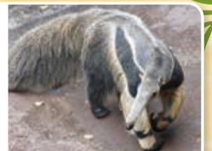
前脚を内側に曲げて歩く

中南米の草原地帯やサバンナ、ジャングルなどに生息しており、丈夫な爪と長さ約60cmにもなる舌を持っています。野生では地上性のシロアリ類を主食にしており、1日に約3万匹のシロアリを食べるといわれています。