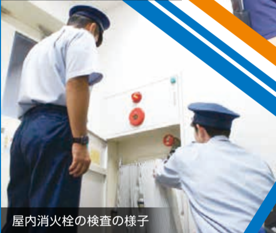
屋内消火栓の検査の様子