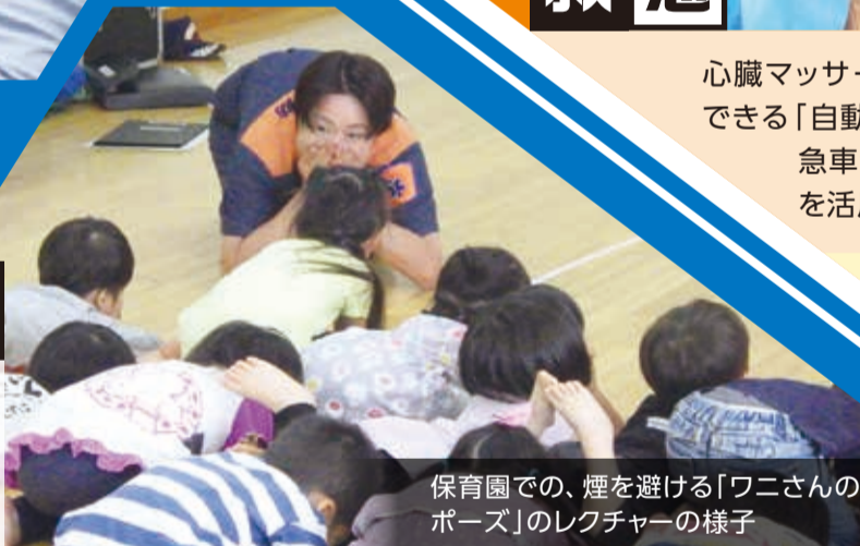
保育園での、煙を避ける「ワニさんのポーズ」のレクチャーの様子

火・煙の恐ろしさや、地震や風水害から身を守る方法などをお子さんから高齢者まで、わかりやすくお伝えします。消防団の皆さんにもご協力いただいています。