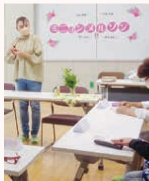
趣味のアロマセラピーで講師にも挑戦

仕事も家庭も忙しいですが、えいやっと気持ちを切り替えて、まずはやってみませんか。