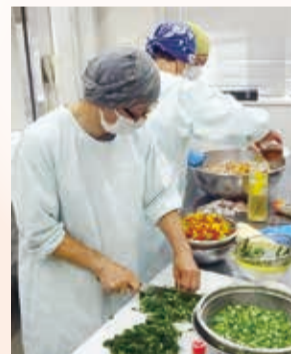
みんなで毎回50個以上のお弁当を作っています