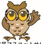
瀬谷区マスコットせやまる