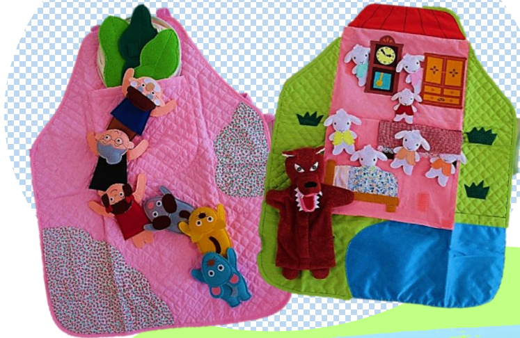
おおかみと7ひきのごやぎ