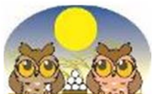
瀬谷区マスコットせやまる・このは