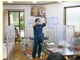
瀬谷消防署の出前講座を開催。家庭内の火災の注意点についてお話がありました。

開催：毎月第1月曜日午前10時～11時30分 場所：夕霧町内会館と南台第2公園 参加費：100円/人