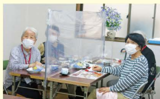
◀ 飛沫防止用支柱とビニールシートをこのように設置 ▶

今年で15年目になる宮沢1丁目のサロンです。現在、感染症対策として人数制限し、参加者は15名程度。会場の夕霧会館内で貸出し機材「 飛沫防止用支柱とビニールシート 」を使って、お茶をしながら皆さんで会話を楽しんだり、スタッフによるキーボード演奏でハミングをしたり、機材を上手に活用しながら集まっています。 サロンの主催者さまからは「貸出し機材で安心して開催できています」と喜ばれています。