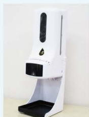
体温測定付きアルコール噴霧器