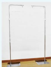
飛沫防止用支柱シート