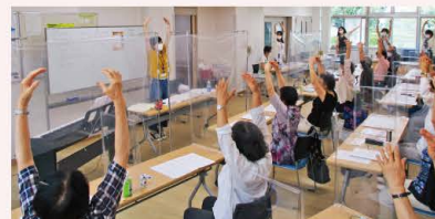
▲ 講師とは飛沫防止用支柱で、横の方とは 卓上カウンターシールド で対策して活動中。