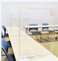
卓上カウンターシールド