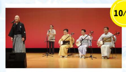
10/20 民謡 三味線 すいせい会さん