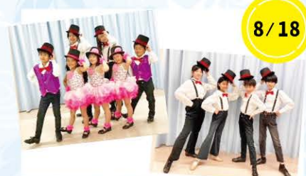
8/18 ジュニアのタップダンスショー TAP DANCERS 2023さん

開催日時 毎月原則第3金曜日 12時20分～12時50分(12時開場) 開催会場 瀬谷公会堂 2階 講堂