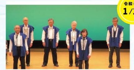
令和6年 1/19 相撲甚句、名所甚句、コミック甚句など 瀬谷相撲甚句会さん