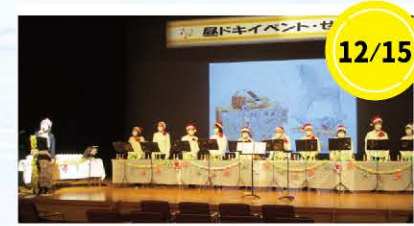
12/15 ミュージックベル演奏 ミュージックベル・にじさん