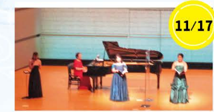
11/17 女声二重唱&ピアノ Frau Felsensteinさん