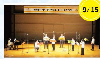
9/15 フルーツ演奏 フルーツアンサンブル YSFEさん