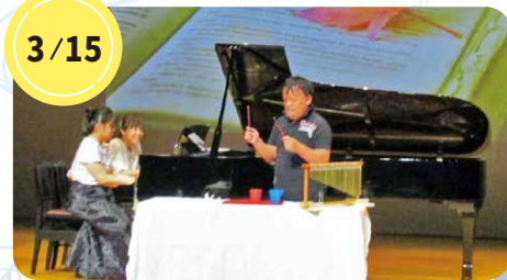
ピアノ連弾と器楽によるアンサンブル アンサンブル・ミル・プランタンさん

地域で活動するさまざまなジャンルのグループが、日ごろの活動や練習成果を発表するお昼休みイベントです。