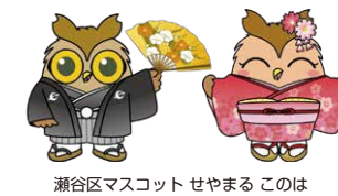
瀬谷区マスコット せやまる このは