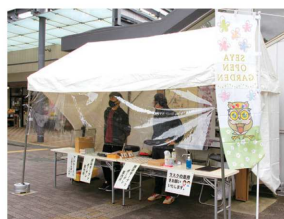
瀬谷駅北口駅前広場

オープンガーデンの開放期間に合わせてパンフレットの配布や各会場のアクセス、みどころ等の案内を行うオープンガーデン特設案内所を設置します。