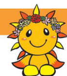
旭区マスコットキャラクター あさひくん