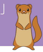
栄区いたち川マスコット タッチーくん