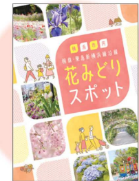
冊子「花みどりスポット」