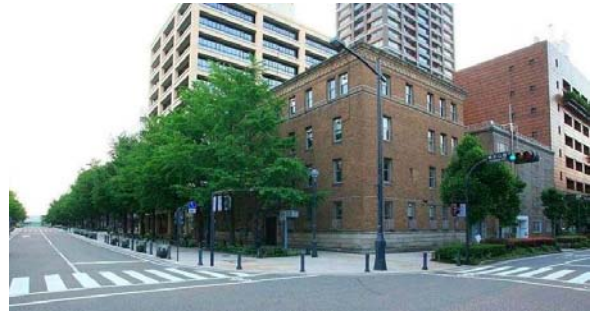
〔旧関東財務局 外観〕