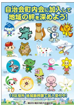
加入促進ポスター