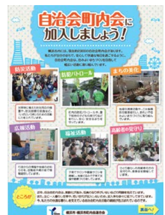
加入促進チラシ（全市版）