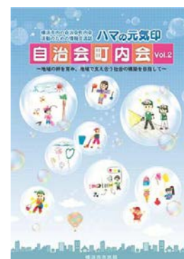
情報交流誌 vol.2（26年度発行）