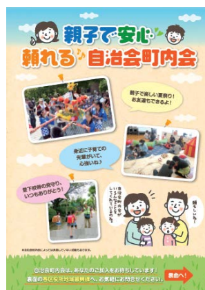
加入促進チラシ（親子向け）