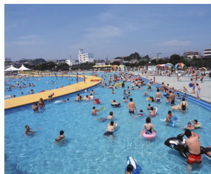
横浜プールセンター