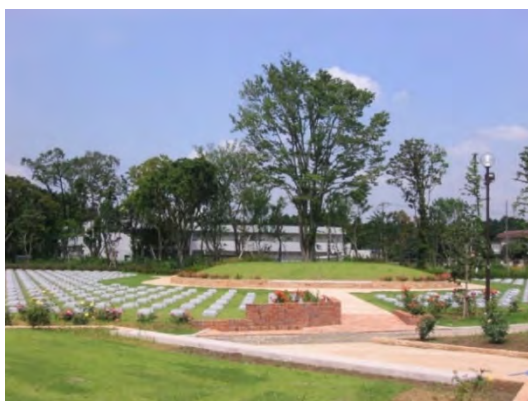
メモリアルグリーン

メモリアルグリーン（戸塚区）、日野こもれび納骨堂（港南区）、（仮称）舞岡墓園（戸塚区：整備中）