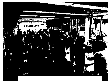
ボランティアの集い

毎年の恒例行事となった年末の『大掃除大会』では、日頃当地域プラザを利用している団体の皆さんと共に部屋の清掃や備品の整理を行っています。掃除後の交流会では、各団体の自己紹介・PR大会となり、相互の交流を深める機会となっています。また、当地域ケアプラザ内や地域で日頃活動されているボランティア団体・個人の皆さんへ感謝の気持ちを伝える『ボランティアの集い』を毎年1回行っています。お互いの活動に参加し合う場面が見られるなど、拠点での出会いや拠点からの情報発信が団体同士をつなぐきっかけづくりにもなっています。