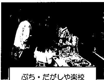
ぶち・だがしや楽校

当プラザが担当する東戸塚・川上地区は年少人口の多い地区です。戸塚区地域子育て支援拠点「とっとの芽」や関係機関とも顔の見える関係の中で日頃より事業を進めています。子育て支援連絡会で地域特性の課題として挙げた「高齢出産・子育て」とともに「ダブルケア」の不安に寄り添うべく、平成27年度に『東戸塚 VERY の会』を立ち上げました。35歳以上で初産婦の方を対象に実施していますが、年々参加者も増え、28年度より地域ケアプラザの主催事業として展開しています。以前は子連れ参加者だった方がOGとなり、そのまま参加者の良きアドバイザーとなっているなど、グループの輪が広がっています。また、小学校や学童保育とも連携し、子ども