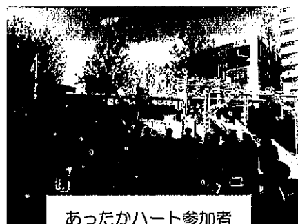
あったかハート参加者

その結果、銀行やコンビニから認知症と思われる“気になる高齢者”などが来店し困った際に直接当ケアプラザに連絡や相談が入るなど、日常業務のパートナーとしてお互いが機能し、見守りのネットワークが広がりました。支援が必要な人をキャッチし、つなぐ役割を担う体制も築いてきました。認知症の啓発事業「あったかハート in 東戸塚」では、企業・店舗とともに介護保険事業所や施設も加わり、協働事業として実施しています。事業をきっかけに、当ケアプラザから企業・店舗に働きかけた結果、『戸塚区みまもりネット』の協力事業者も増えています。