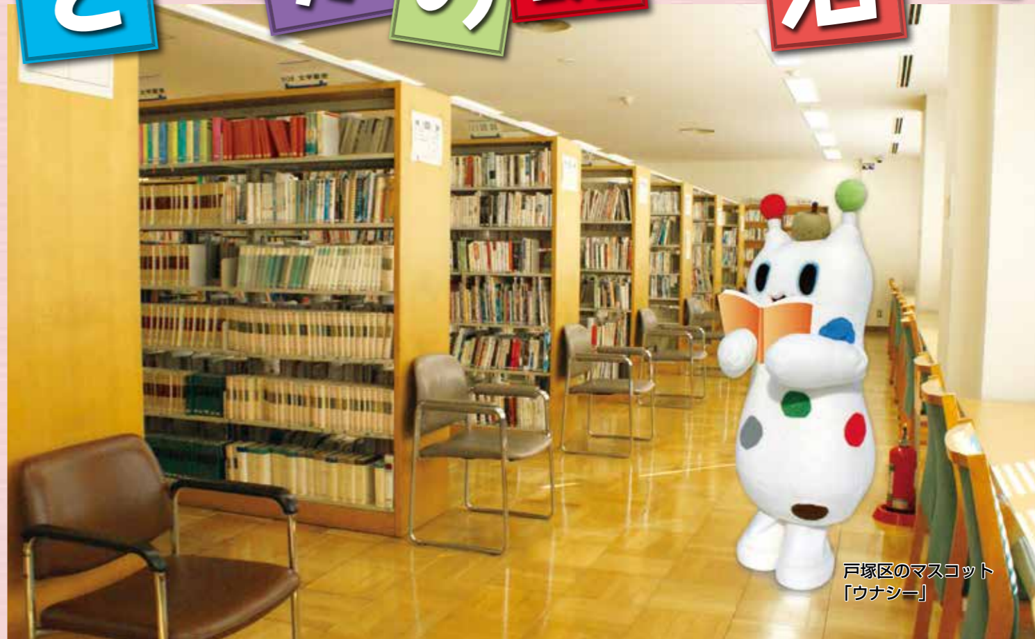
戸塚区のマスコット「ウナシー」