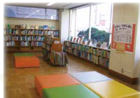
戸塚図書館 絵本・紙芝居コーナー