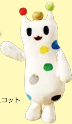
戸塚区のマスコット「ウナシー」