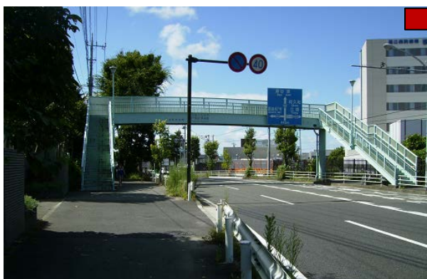
歩道橋撤去前の写真

通行車両の多い道路のため、クレーン車による歩道橋の撤去作業は、5日間にわたり夜間に行われました。