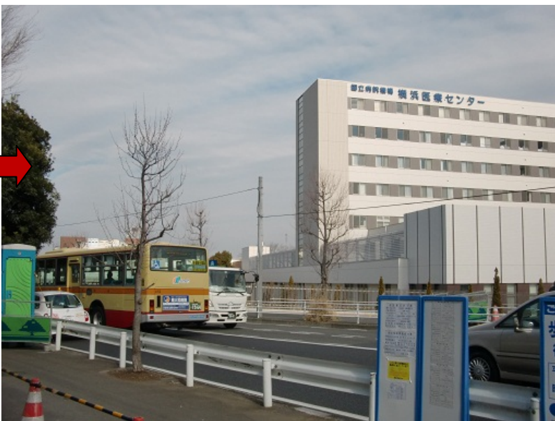
歩道橋撤去後の写真