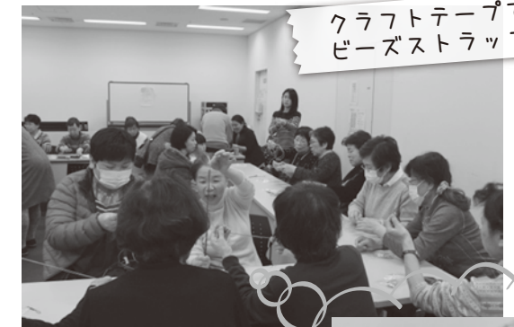
クラフトテープで作るビーズストラップ