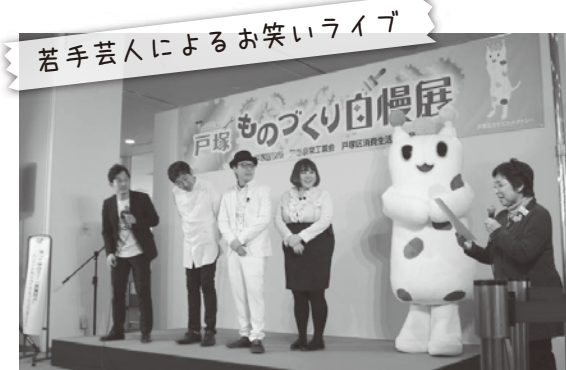
若手芸人によるお笑いライブ