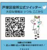
▲駅や店舗など身近な生活の中でも、情報をキャッチ!