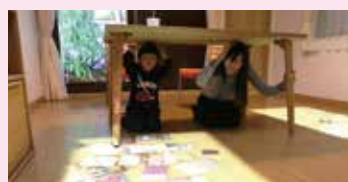
▲リアルな体験で災害をイメージ