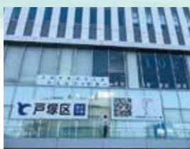
▲区庁舎壁面に約2m×2mの巨大二次元コードが出現!