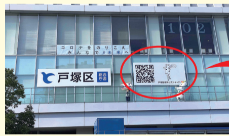
▲JR戸塚駅ホームからも読み取れる二次元コード

リアルタイムに情報収集ができるSNSは災害時にはとても有効ですが、デマなどの情報が含まれていることもあります。行政など信頼性の高いところからの情報収集が重要!