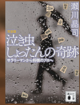
『泣き虫しよったんの奇跡』瀬川晶司 / 著 講談社

読書の秋、今年は戸塚区在住のプロ棋士による読書講演会を開催します。奨励会を年齢制限で退会后、特例によって2005年に実施されたプロ編入試験に合格し、棋士となった自身の経験を綴った『泣き虫しよったんの奇跡』(講談社文庫)は、2018年に映画化もされました。将棋ファン、読書好きな人はもちろん、今まで本に触れる機会が少なかった人も著者を通して読書の新たな楽しみを見つけませんか。