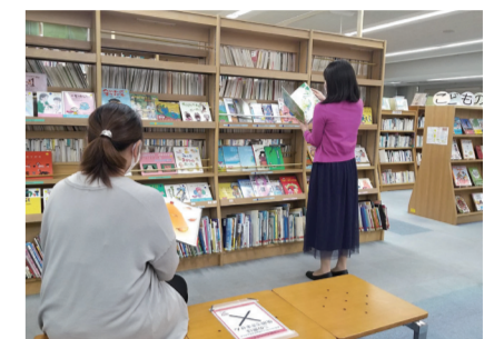
▲男女共同参画センター横浜

※区内はドリームハイツ第一公園と品濃谷宿公園、名瀬下第三公園を巡回 巡回日程はこちら▶