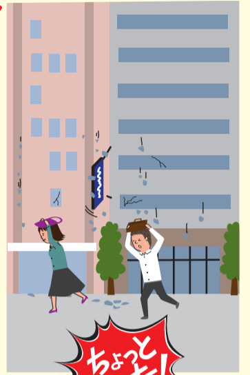
東日本大震災時の横浜駅周辺の状況