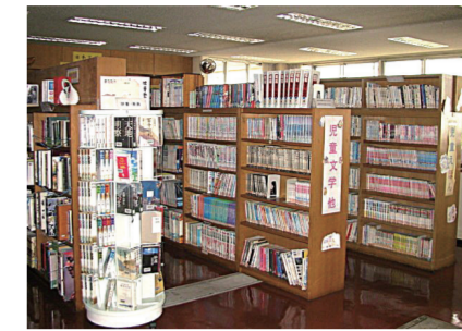
▲大正地区センター