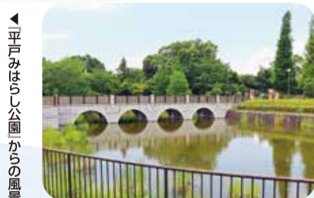
▲平戸みはらし公園からの風景