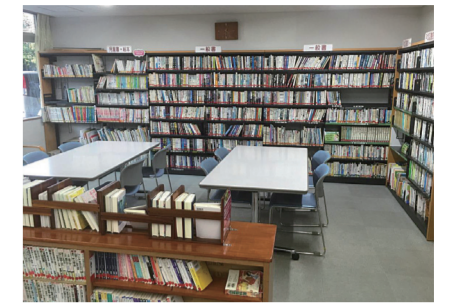
▲汲沢地域ケアプラザ