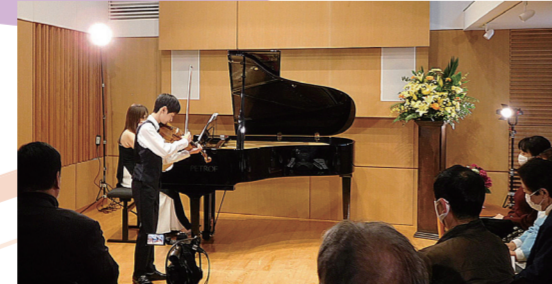
会場のひとつである Sala MASAKA (品濃町 514・13)

※昨年の様子 ● 演奏者と観客の一体感ある演奏会を目指しています。毎年どんな才能がある子が演奏してくれるのか楽しみです。