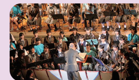
▲ステージ発表の様子