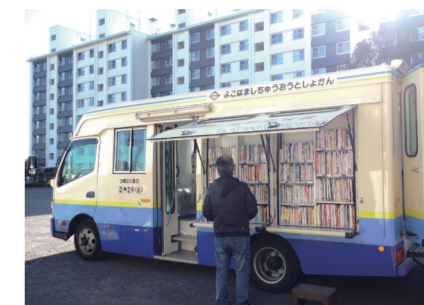
▲はまかぜ号(＠ドリームハイツ第一公園)