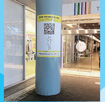
▲戸塚駅西口バスセンター