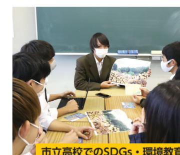
市立高校でのSDGs・環境教育

地域における環境やSDGsの取組推進のため、講演会やパネル展を実施します。また、区内市立学校に対し、SDGs学習プログラムガイドの配布や、区内企業、北海道下川町などと連携した環境教育を実施します。