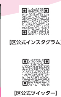
区公式インスタグラム