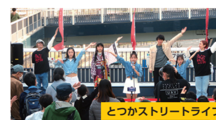
とつかストリートライブ

アーティストによる体験コンサートなどを実施し、気軽に音楽と触れ合う場をつくります。