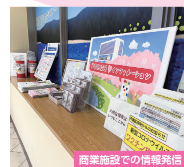
商業施設での情報発信