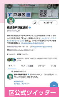
区公式ツイッター