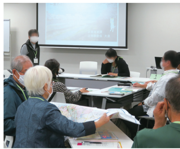
最終講では、一緒に学んできた仲間と講座を振り返ります。

歴史、防災、区内巡りなど、地域に興味を持つきっかけとなる講座を用意しています。見て・聞いて・感じて、楽しく学びながら「とつカ」を知ることができます。