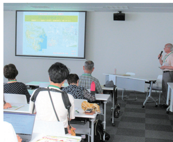
地域の居場所づくりや活性化などについて、本格的に学びます。

住んでよかったと思える地域を自分たちの手で実現する手法を学びます。まちに出向き、自分の目を見て、実践者の話を聞き、感じて、学びを深めることを大切にしています。