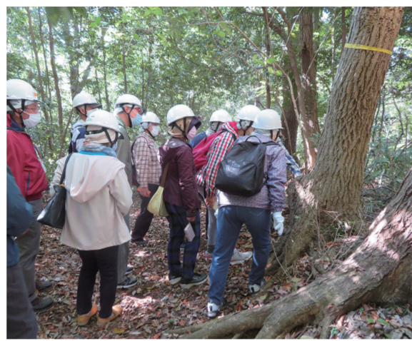
森林インストラクターの話を聞きながら区内の公園や森を散策。