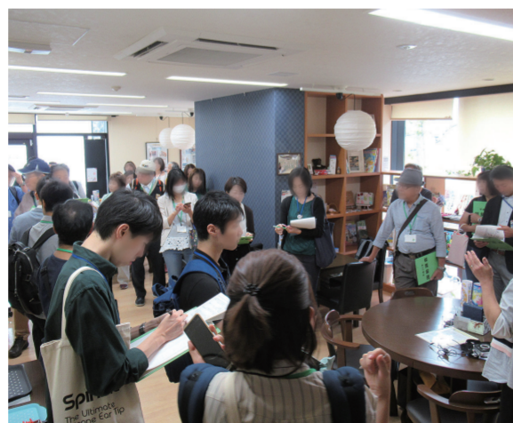
実際に区内の活動現場を訪問したり、まち歩きをします。