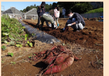
▲サツマイモ堀り体験も(10月頃)

10・11月頃にはカキやミカン、1～5月頃にはイチゴ、6～8月頃にはブルーベリー、8・9月頃にはナシやブドウなど、区内ではいろいろな収穫体験ができます。