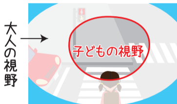
子どもの視野はこんなに小さい！

! 子どもに伝えよう 子どもの見えている視野の範囲は大人よりも狭いです。周りをよく見て気を付けるように伝えましょう。