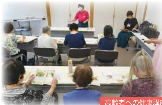
高齢者への健康講座