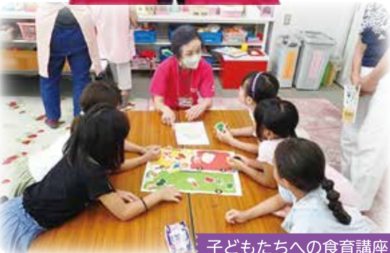
子どもたちへの食育講座

食生活等改善推進員(愛称:ヘルスメイト)は「私達の健康は私達の手で」を合言葉に、地域で健康づくりを推進するボランティア団体です。